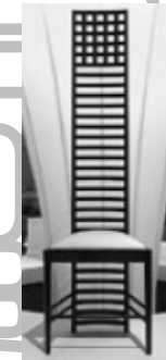
/ Charles Eames