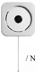
/ Naoto Fukasawa