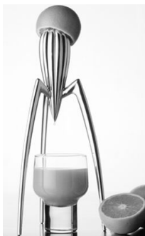
/ Philippe Starck