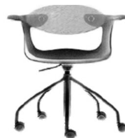
/ Ross Lovegrove